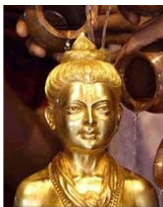
Mahavira (± 500 v.o.j.)

Jain betekent: zij die het geweld (‘schade toebrengen’) overwonnen hebben. Dit gold vooral voor de 24 Tirthankara ’s: degenen die het voor anderen mogelijk maakten om tot Bevrijding (uit de kringloop van geboorte, dood en wedergeboorte) te komen, door het pad dat tot die bevrijding leidt te onder-